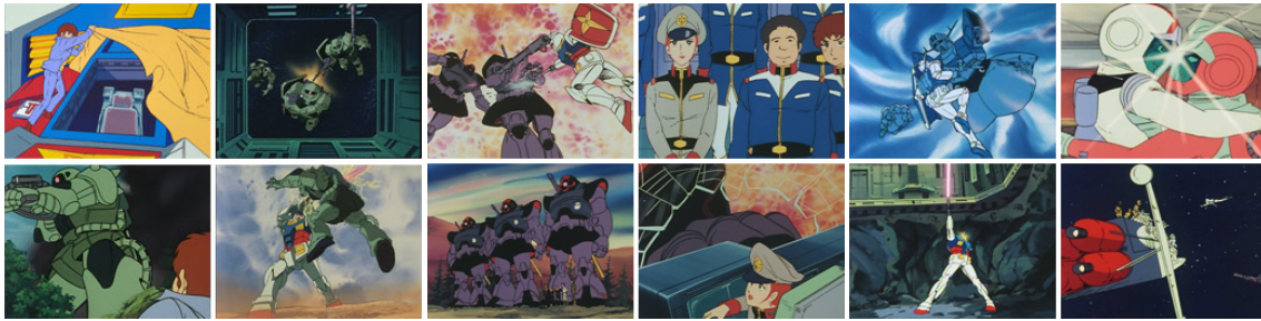
図 2: 機動戦士ガンダムの名シーンの数々。しかも 2 段組みを無視。ただし現在はページのトップにしか入らない仕様のようである。

も忘れてはならない！それをガルマは死を以って我々に示してくれたのだ！我々は今、この怒りを結集し、連邦軍に叩きつけて初めて真の勝利を得ることが出来る。この勝利こそ、戦死者全てへの最大の慰めとなる。国民よ立て！悲しみを怒りに変えて、立てよ国民！ジオンは諸君等の力を欲しているのだ。ジーク・ジオン！！Frey et al. [2003]でも同じような事を言っています。ちなみに鈴木他 [2004]では違います。